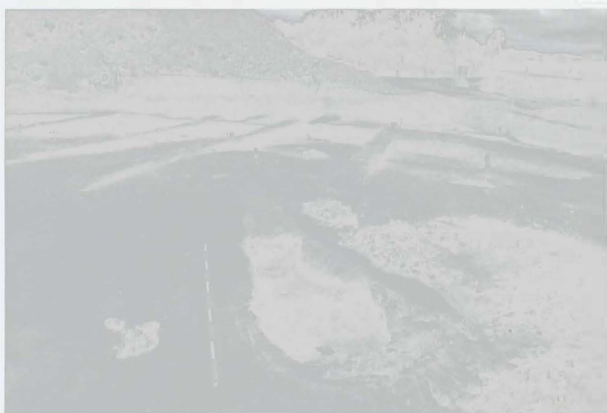
Obr. 6: Kuchařovice, pohled od severu na prozkoumanou pec I a za ní na rozsáhlou zahloubeninu vyplněnou metalurgickým odpadem. Abb. 6: Kuchařovice, Blick vom Norden auf den Ofen Nr. I und auf die durch metallurgischen Abfall ausgefüllte ausgedehnte Grube dahinten.