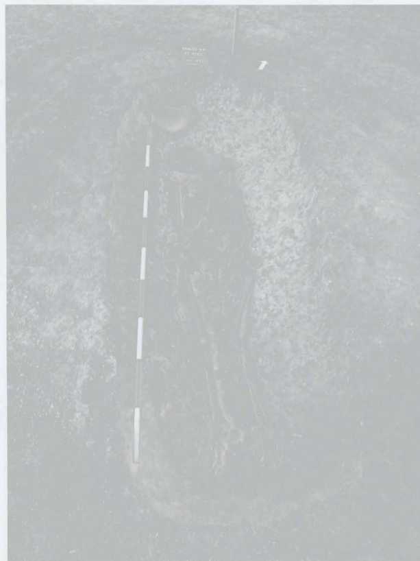
Obr. 4: Kralice na Hané, Průmyslová zóna města Prostějova. Laténský kostrový hrob. Abb. 4: Kralice na Hané, Industriezone der Stadt Prostějov. Latènezeitliches Körpergrab.