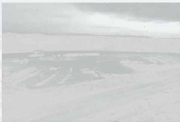
Obr. 5: Kuchařovice, pohled od jihovýchodu na prozkoumaný metalurgický komplex, vpravo nálezy strusky. Abb. 5: Kuchařovice, Blick vom Südosten auf das ausgegrabenen metallurgischen Areal, rechts die Schlackenfunde.

Kuchařovice (Bez. Znojmo). Latènezeit (LT C). Metallurgisches Areal. Rettungsgrabung.