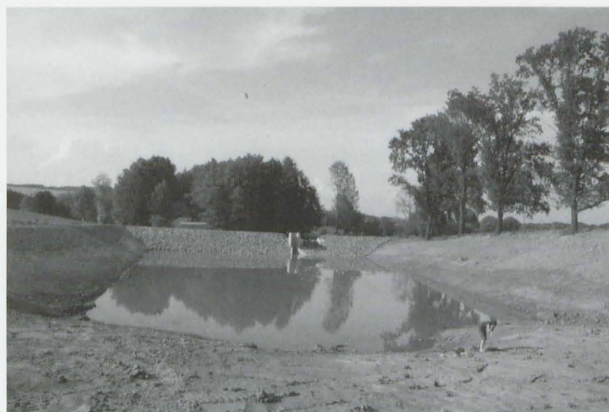
Obr. 27: Věžky „Horní rybník“. Pohled od jihu. Abb. 27: Věžky „Horní rybník“. Blick von Süd

V průběhu roku 2007 byly ve Věžkách u Kroměříže vybudovány dva rybníky (v místě původních) za účelem protipovodňového opatření. Povrchovým sběrem v červnu téhož roku byl na jižním břehu nově budovaného „Horního rybníka“ (obr. 27), situovaného na bezejmenném pravostranném přítoku Věžeckého potoka, nalezen soubor keramiky z doby bronzové.