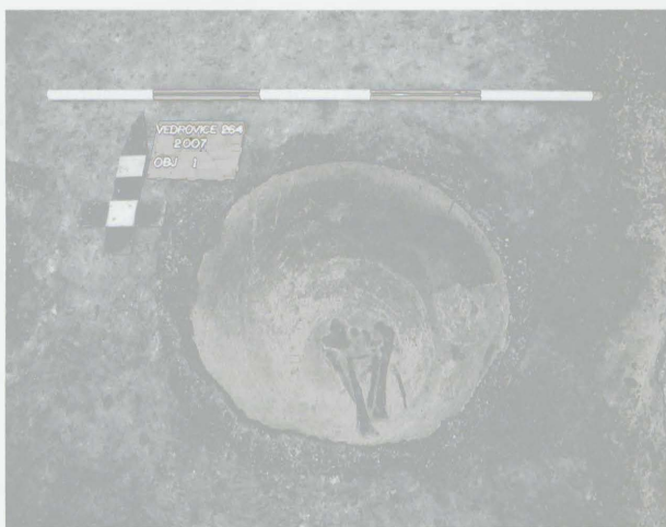
Obr. 26: Vedrovice. Spodní část keramické zásobnice s dětským kostrovým pohřbem. Abb. 26: Vedrovice. Unterteil des Vorratgefäßes mit Kinderskelettbestattung.