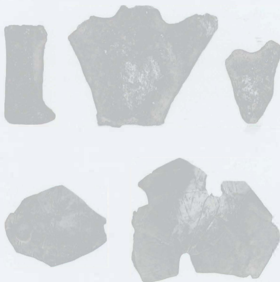
Obr. 20: Popůvky (okr. Brno-venkov). Výběr materiálu. Abb. 20: Popůvky (Bez. Brno-venkov). Materialauswahl.

Popůvky (bez. Brno-venkov). „Pod Šípem“. MBK. Siedlung. Rettungsgrabung.