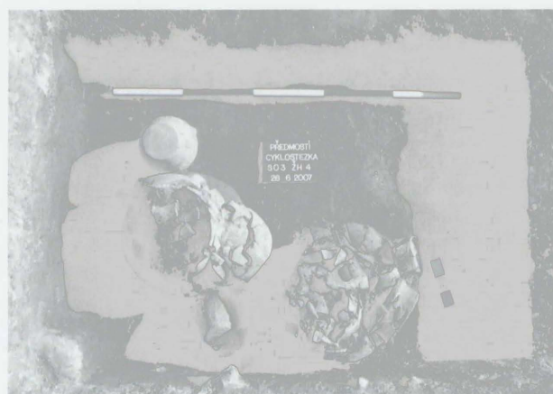
Obr. 23: Přerov, k. ú. Předmostí u Přerova. Foto dvou mladobronzových lužických hrobů. Abb. 23: Přerov - Předmostí. Photo von zwei Gräbern der Lausitzer Urnenfelderkultur.