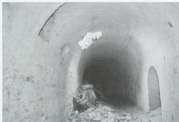
Obr. 80: Olomouc, Neředín. Pohled do hlavní galerie. Abb. 80: Olomouc, Neředín. Blick in die Hauptgalerie.

fortu (Duffy 1998, 74). Stavební konstrukce byla vybudována z cihel spojených maltou. Kámen s maltou se nacházel pouze ve východní polovině nad úrovní klenby (jižní profil). Konstrukci klenby hlavní galerie převrstvoval písčité jílo, pravděpodobně pro jeho dobré izolační vlastnosti, zabraňující průsaku vody a tím i vlhkosti stavby. Stavbou silniční komunikace došlo ke zrušení příkopu, kontreskarpy i hlavní galerie a celý objekt (pevnostní systém) byl zasypán terénními vyrovnávkami.