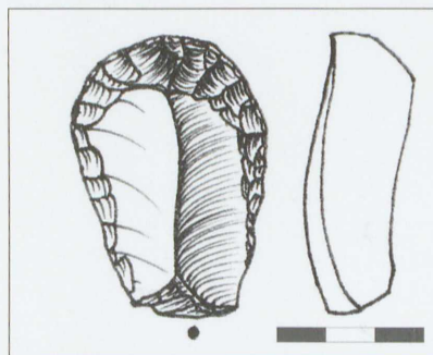
Obr. 52: Lhotka u Zlína. Drobné škrabadlo na úštěpu. Fig. 52: Lhotka u Zlína. Small flake endscraper.

An isolated artifact was found during a surface survey in the „Vesníky“ field near Lhota u Zlína. The small flake endscraper was made from patinated Krakow-Czestochowa Jurassic flint (obr. 52) and it can be classified as Late Paleolithic (?).