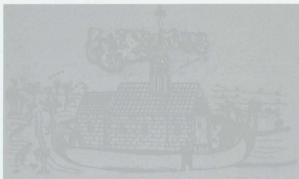
Obr. 5: Bouzov, kostel sv. Maří Magdalény z roku 1680 (z pozůstalosti P. Janáka). Abb. 5: Bouzov, Kirche St. Maria Magdalene.

Ve vzdálenosti přibližně 1 km jihovýchodně od Bouzova, v části Starý pivovar, kde od 16. stol. fungoval vrchnostenský pivovar, je situován kostel sv. Maří Magdalény. V jeho okolí, podle lidové ústní tradice, stála původní osada, tzv. Starý Bouzov. Kostel sv. Maří Magdalény měl až do roku 1725 farní práva a dle patrocinia lze soudit na jeho počátky ve 13. století. Na možný pozdněrománský původ ukazuje zejména vyobrazení kostela z roku 1680 v bouzovské matrice (srov. Pinkava 1903, 158 – obr. 37), zachycují typické kvádrkové zdivo a románský typ oken (obr. 5). Z tohoto horizontu mohou pocházet i čtyři kvádrky o rozměrech 25 × 38 cm a 25 × 45 cm zakomponované do hřbitovní zdi. Severně od kostela sv. Maří Magdalény byl povrchovým sběrem získán soubor cca 150 zloмок keramiky s příměsí jemně mleté tuhy ve hmotě a s římsovitými okraji.