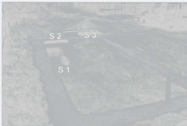
Obr. 19: Opava-Kylešovice. Terénní situace na lokalitě a rozmístění jednotlivých sond. Fig. 19: Opava-Kylešovice. The excavation and the distribution of trenches.

Opava (Kat. Kylešovice, Bez. Opava). Bauter Teil der Gemeinde. LBK, MBK. Siedlung. Rettungsgrabung.