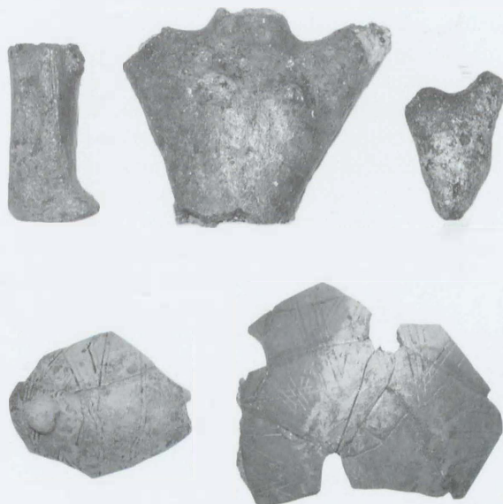
Obr. 20: Popůvky (okr. Brno-venkov). Výběr materiálu. Abb. 20: Popůvky (Bez. Brno-venkov). Materialauswahl.

Popůvky (bez. Brno-venkov). „Pod Šípem“. MBK. Siedlung. Rettungsgrabung.