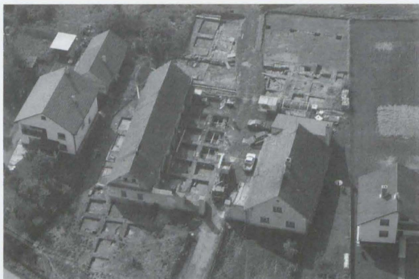
Obr. 55: Hladké Životice. Pohled na plochu archeologického výzkumu v r. 2006. Letecký snímek. Abb. 55: Hladké Životice. Blick auf die Grabungsfläche im Jahre 2007. Fliegeraufnahme.

shluk kůlových jamek a pravděpodobně i navazující relikt plotu, který se podařilo sledovat i v exteriéru budovy.