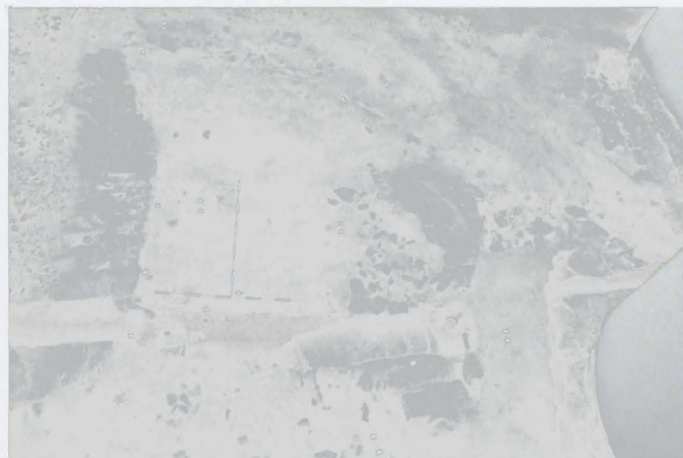
Obr. 56: Hradec nad Moravicí. Pohled od východu na zkoumanou plochu. Abb. 56: Hradec nad Moravicí. Grabungsfläche von Osten.

černé hlíny, obsahující velké množství keramických fragmentů, zvířecích kostí a jiného organického materiálu. Funkci zjištěného žlábků nelze jednoznačně stanovit, ale vzhledem k jeho výplni je možné, že se jednalo o kanál odvádějící vodu z plochy ostrožny. Možnost, že by se jednalo o příkop, lze snad s ohledem na rozměry vyloučit.