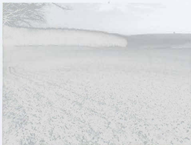
Obr. 5: Žebětín-Pekárna. Pohled na lokalitu od západu. Abb. 5: Žebětín-Pekárna. A view of the Neolithic settlement from the west.