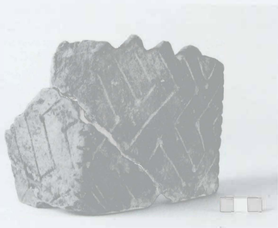
Obr. 7: Hulín. „Višňovce“. Kvadratická nádoba LnK. Abb. 7: Quadratgefäß der LBK.

„Prostřední díly“. MMK (?). Sídliště. Záchranný výzkum.