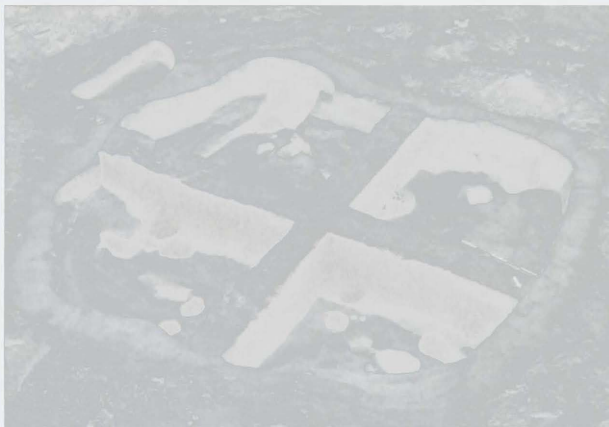
Obr. 8: Polešovice. Zemnice z doby halštatské. Abb. 8: Polešovice. Hallstattzeitliches Grubenhaus.

Polešovice (Bez. Uherské Hradiště), „Nivy“. Hallstattzeit. Latènezeit. Siedlung. Rettungsgrabung.