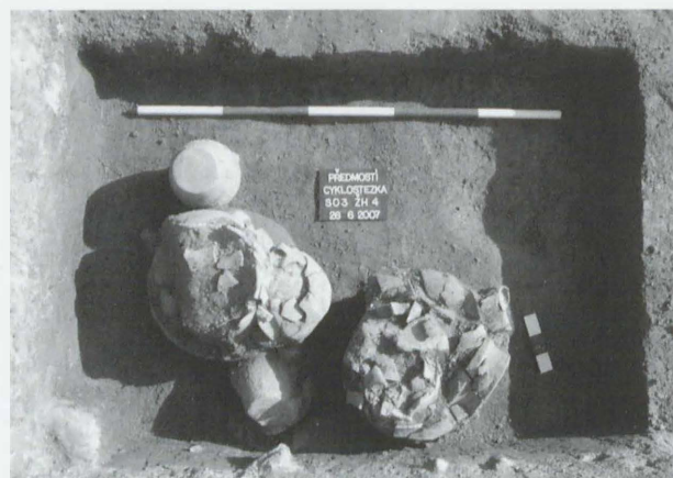
Obr. 23: Přerov, k. ú. Předmostí u Přerova. Foto dvou mladobronzových lužických hrobů. Abb. 23: Přerov - Předmostí. Photo von zwei Gräbern der Lausitzer Urnenfelderkultur.