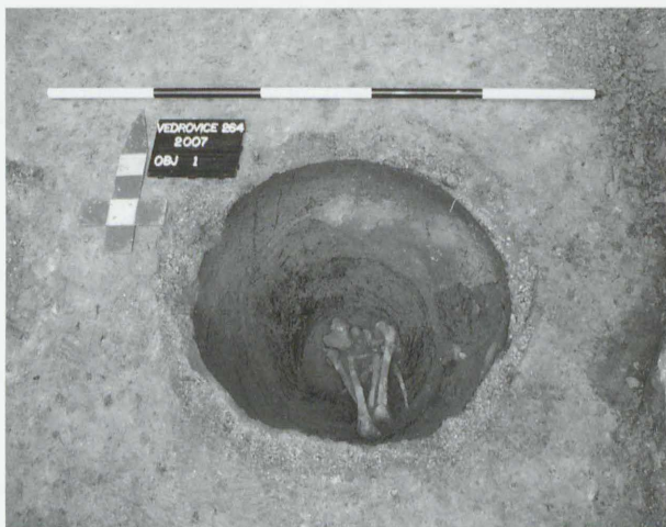
Obr. 26: Vedrovice. Spodní část keramické zásobnice s dětským kostrovým pohřbem. Abb. 26: Vedrovice. Unterteil des Vorratgefäßes mit Kinderskelettbestattung.