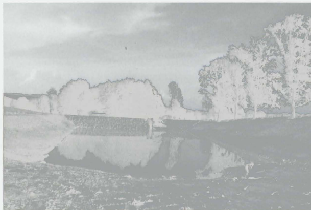
Obr. 27: Věžky „Horní rybník“. Pohled od jihu. Abb. 27: Věžky „Horní rybník“. Blick von Süd

V průběhu roku 2007 byly ve Věžkách u Kroměříže vybudovány dva rybníky (v místě původních) za účelem protipovodňového opatření. Povrchovým sběrem v červnu téhož roku byl na jižním břehu nově budovaného „Horního rybníka“ (obr. 27), situovaného na bezejmenném pravostranném přítoku Věžeckého potoka, nalezen soubor keramiky z doby bronzové.