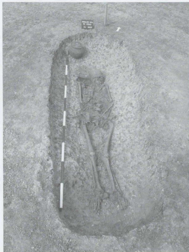
Obr. 4: Kralice na Hané, Průmyslová zóna města Prostějova. Laténský kostrový hrob. Abb. 4: Kralice na Hané, Industriezone der Stadt Prostějov. Latènezeitliches Körpergrab.