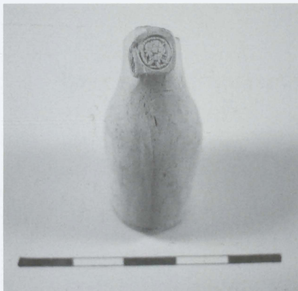
Obr. 110: Týn nad Bečvou. Detail značky. Abb. 110: Týn nad Bečvou. Detail der Marke.