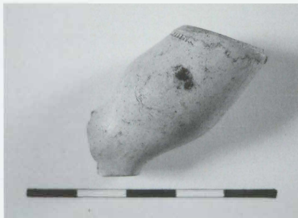
Obr. 109: Týn nad Bečvou. Torzo hliněné dýmky. Abb. 109: Týn nad Bečvou. Pfeifefragmente.

nožka pod hlavičkou, do které je vtačena značka připomínající pětibokou rožmberskou růži (obr. 110). Je třeba zmínit, že helfštýnské panství i s hradem vlastnil Petr Vok z Rožmberka od roku 1580–1593, kdy ho následně prodal Hynku Bruntálskému z Vrbna.