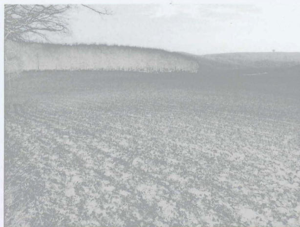
Obr. 5: Žebětín-Pekárna. Pohled na lokalitu od západu. Abb. 5: Žebětín-Pekárna. A view of the Neolithic settlement from the west.