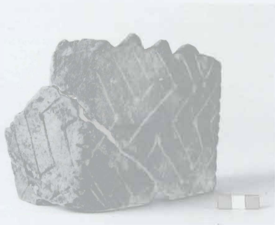
Obr. 7: Hulín. „Višňovce“. Kvadratická nádoba LnK. Abb. 7: Quadratgefäß der LBK.

„Prostřední díly“. MMK (?). Sídliště. Záchranný výzkum.