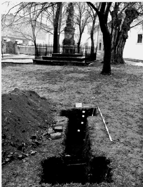
Obr. 109. Olomouc, Václavské náměstí, sonda S 9/06. Olomouc, Václavské Platz, Sondage S 9/06.

Sonda S 9/06 – výkop pro poutač u sochy sv. Jana Nepomuckého měl půdorys ve tvaru písmene H o délce 1,90 m, největší šířce 0,80 m a hloubce 1,00 m (obr. 109). I když se jednalo o poměrně mělký výkop, úroveň terénu z 12. století byla zjištěna v hloubce pouhých 0,30 m od současné úrovně. Prakticky byly zdokumentovány jen dva časové horizonty: 12. a 20. století. Jedná o prostor, kde je rovněž hledán kostel sv. Máří Magdalény.