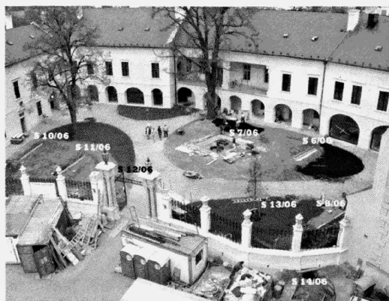
Obr. 108. Olomouc, Václavské náměstí, celkový pohled na čestný dvůr s vyznačenými polohami sond. Olomouc, Václavské Platz, Gesamtsicht des Ehrenhofs mit ausgezeichneter Lage der Sondagen.