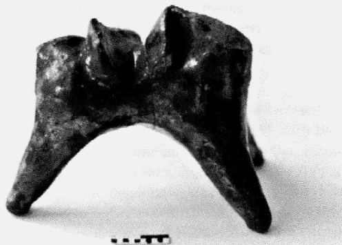
Obr. 123. Ostrava, Masarykovo nám. 2006. Keramická plastika konika ze starší středověké dlažby náměstí (k 376).

Archeologickým dohledem při skrytce konstrukčních vrstev pod recentním zpevněním povrchu byl zjištěn a následně dokumentován původní základ mariánského sloupu, odstraněného ve 2. pol. 20. stol. a obnoveného po r. 1989 (sektor E), a základ, který je pozůstatkem nedochované sochy sv. Floriána (sektor D).