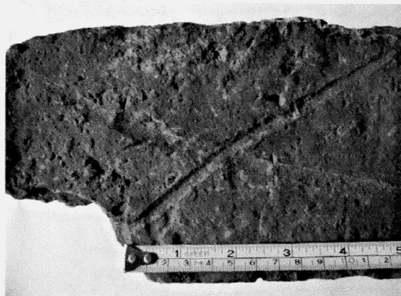
Obr. 127. Pozoříce, hrad Vildenberk. Cihla. Pozoříce, Burg Vildenberk, Ziegel.