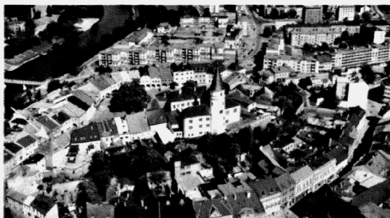
Obr. 130. Přerov, Horní náměstí. Letecký pohled s vyznačením domu č. p. 26. Přerov, Horní Platz. Luftbildaufnahme, ausgezeichnet das Haus Konstr. N. 26.

V roce 2006 byl víceméně ukončen průzkum v prostoru vlastního domu č. p. 26 a jeho nádvorního traktu (parcela č. 330) v areálu Horního náměstí (obr. 130). Výzkum v těchto místech byl zahájen již v zimních měsících roku 1998 a předběžně uzavřen v červnu 2001 (Sonda III). V poslední