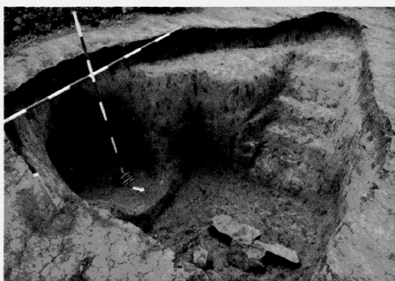
Obr. 129. Prostějov. Suterén nadzemního objektu se vstupním koridorem. Prostějov. Überreste des Erdkellers mit der Eingangstreppe. Mittelalter-Neuzeit.

dochovaly pouze na jejím východním okraji, kde se terén díky naváté spraši poněkud zvedá. Shodou okolností se nacházely ve východním úseku severní odbočky. Nadmořská výška místa výzkumu je cca 210 m.