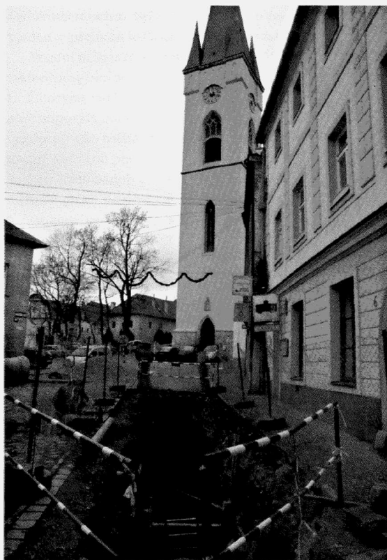
Obr. 13. Znojmo-Mikulášské náměstí. Celkový pohled na průběh výkopu kanalizace v místě sondy 1. Znojmo-Mikulášské náměstí. Gesamtanblick auf der Grabung der Kanalisation in der Stelle der Sonde 1.

Výstavbou rodinných domů v poloze Újezdky pod Žarošicemi těsně u jižního okraje obce se podařilo v další dílčí poloze v červenci 2006 zachytit pozůstatky lidských aktivit mladší doby bronzové, které jsou na ZM ČR 1 : 10 000 (list 24-