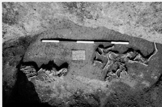
Obr. 7. Hluboké Mašůvky – „Nivky“ (okr. Znojmo). Hluboké Mašůvky – „Nivky“ (Bez. Znojmo).

Hluboké Mašůvky – „Nivky“ (Bez. Znojmo). MÖG (Lengyel II). Siedlung, Tierbestattungen. Rettungsgrabung.