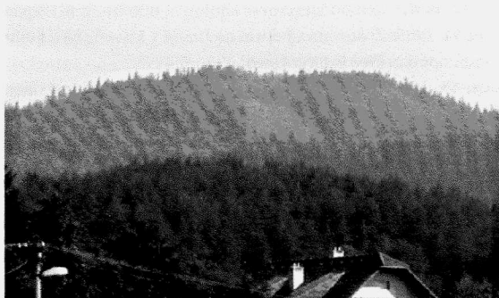
Obr. 148. Vysoké Pole. Pohled na hradiště Klášťov od jihu. Vysoké Pole. Gesamtansicht des Burgwalls Klášťov von Süden.

ského pásma Vizovských vrchů (obr. 147 a 148). Lokalita je situována na ZM 1 : 10 000 (list 25-32-25) od Z. s. č. 86 mm, od J. s. č. 113 a 123 mm. Na základě překvapivých výsledků sondáže v předchozím roce 2005 bylo v tomto roce přikročeno k průzkumu v poněkud větším rozsahu. Bylo dokončeno geodetické zaměření lokality pracovníky ÚAPP Brno, zaměřeny byly i jednotlivé sondy (jak z roku 2005, tak i z roku letošního) a geodeticky byly také zaměřeny nálezy větších archeologických souborů, a to jak uvnitř samotného hradiska, tak i vně jeho areálu. Souběžně byly také s maximální možnou přesností lokalizovány jednotlivé nálezy archeologické povahy, a to v prostoru dvou hlavních sídlištních okrsků na vnitřní ploše hradiska (vrcholový hřeben lokality se skaliskem „Čer-