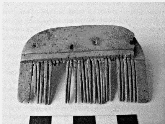
Obr. 8. Olomouc-Neředín. Kostěný hřeben z doby římské. Olomouc-Neředín. Knochkamm der römischen Kaiserzeit.

Nová lokalita v Olomouci-Neředíně na rozhraní trati „Mýlina“ a „Úzké díly“ se nachází na výrazném, severně orien-