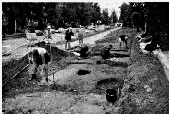
Obr. 136. Přerov, Hranická ulice. Detail plochy s částí odkrytého mladohradištního pohřebiště. Hranická Strasse. Detailsicht der Grabungsfläche mit einem Teil des freigelegten junburgwallzeitlichen Gräberfeldes.