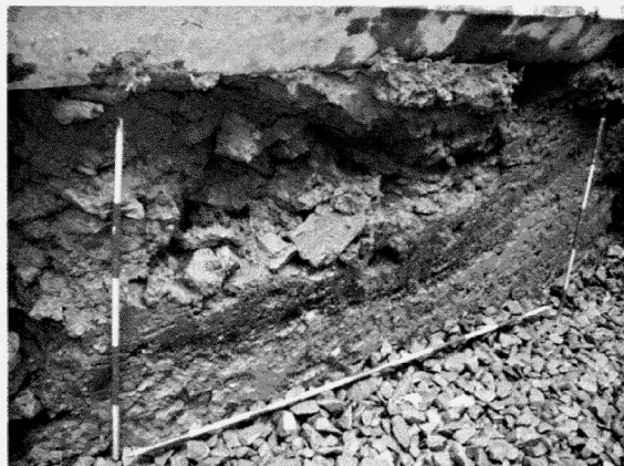
Obr. 146. Uherské Hradiště, Protzkarova ulice, severo-východní profil. Kamenná destrukce velkomoravského stáří nasadající na hlinitokalovou vrstvu s nálezy keramiky a zvířecích kostí. Pod ní patrně rostle jílovité podloží původního ostrova. Uherské Hradiště, Protzkarova Strasse, das nord-östliche Profil. Die Steinzerrütung des großmährischen Alters aufsteigend auf trüblehmige Schicht mit Funden von Keramik und Tierknochen. Darunter ist gewachsene Schlickbasis der ursprünglichen Insel zu sehen.

S kolonizačním horizontem budování města souvisí nálezy dvou dřevěných částí při vyústění ulice Protzkarovy ze Zelného trhu. Zde byly dělníky vytaženy z hloubky asi 300