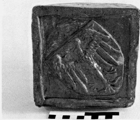
Obr. 113. Opava, Drúbeží trh. Keramický kamnový kachel z jímky k. 508.

Opava. Str. Drúbeží trh. Ofenkachel aus der Latrine Nr. 508.