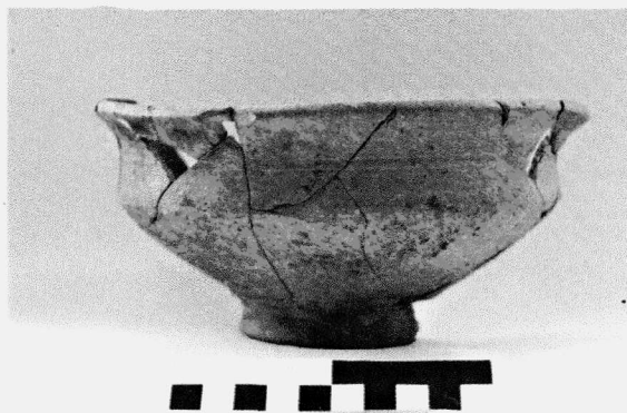
Obr. 10. Opava. Rekonstrukce germánské mísy na nožce z polozemnice.

Opava. Rekonstruktion einer germanischen Fußschale aus dem Grubenhaus.