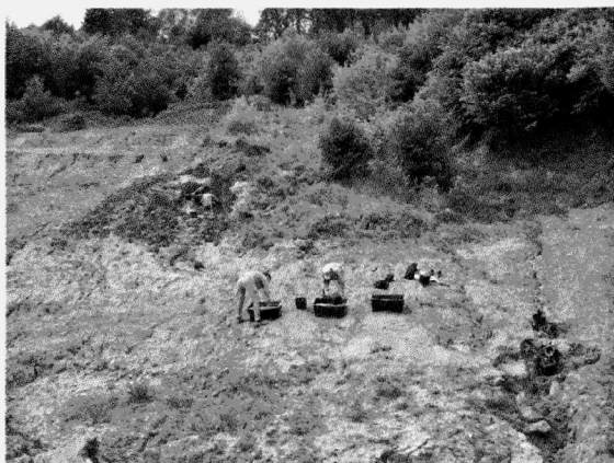
Obr. 15. Napajedla-Zámoraví. Výzkum lokality. Napajedla-Zámoraví. Excavation.

V letech 2005 a 2006 bylo ze zmíněné vrstvy (geologický popis viz Škrdla – Nývltová Fišáková – Nývlt 2006) získáno 34