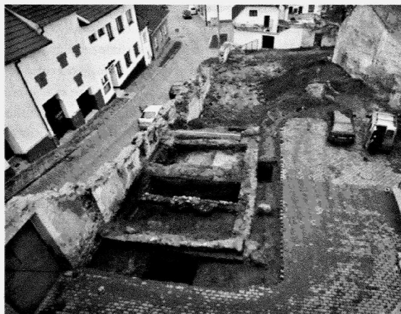
Obr. 144. Tišnov. Pohled od severovýchodu na plochu výzkumu.

Tišnov. Grabungsfläche. Blick vom Nordosten.