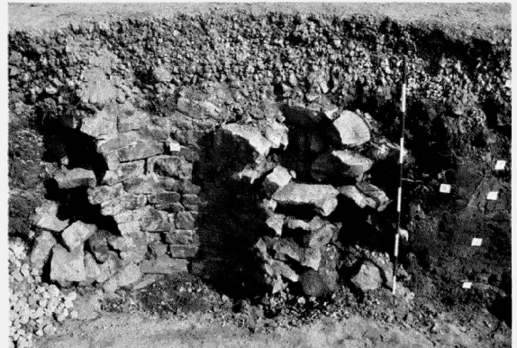
Obr. 118. Ostrava, Cingrova ulice. Detail reliktu zdiva (studna, cisterna?), profil P3. Pohled od severu. Ostrava, Cingrova Str. Rest einer Mauer (vom Brunnen oder Zisterne), Schnitt P3, Blick von Norden.

Ostrava (Kataster Moravská Ostrava, Bez. Ostrava). Cingrova Str. Neuzeit. Stadt. Rettungsgrabung.