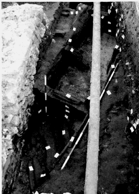
Obr. 116. Opava, náměstí Osvoboditelů-Janáčkovy sady. Úsek vydrženého odvodňovacího koryta ze 13. století s patrnými fixačními kolíky a rozpěrami (sonda S13); ve dně patrný průběh dřevěného překrytí staršího koryta. Pohled od západu. Opava, Platz náměstí Osvoboditelů-Janáčkovy sady str. Der Abschnitt einer Holz-Abwässerungsrinne aus dem 13. Jahrhundert mit sichtbaren Pflöcken und Spriessen (Sondage S 13). Im Boden ist die Holzabdeckung des älteren Gräbchens. Blick von Westen.

V místech někdejšího barokního bastionu, chránícího systém Ratibořské brány, byly pod mocnou vrstvou přemístěných náplavových hlín, související s výstavbou barokních fortifikačních prvků nebo jejich zánikem, evidovány středověké situace včetně několika úrovní štětových úprav povrchu. Registrovány byly rovněž pozůstatky dřevěné cesty a vrstvy, která obsahovala velké fragmenty keramiky, popř. celé nádoby (rámcově datovatelné do 13.–14. století); jedná se pravděpodobně o komunikačně využívaný prostor vně městského opevňovacího příkopu, přičemž nelze vyloučit, že částečně rovněž mohl sloužit k deponování městského odpadu.