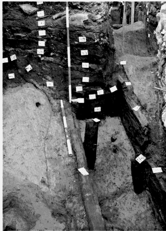
Obr. 117. Opava, náměstí Osvoboditelů-Janáčkovy sady. Pohled na stratigrafickou sekvenci středověkých vrstev v sondě S13; detail konstrukčního řešení vydrženého odvodňovacího koryta ze 13. století. Pohled od východu. Opava, Platz náměstí Osvoboditelů-Janáčkovy sady str. Blick auf die mittelalterliche Schichtenabfolge in der Sondage S13; Detail der hölzernen Abwässerungsrinne aus dem 13. Jahrhundert. Blick von Osten.