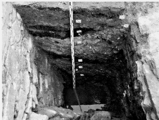
Obr. 115. Opava, náměstí Osvoboditelů-Janáčkovy sady. Zdivo fortifikačního systému Ratibořské brány a zásyp příkopu v sondě S8. Pohled od západu. Opava, Platz Osvoboditelů-Janáčkovy sady. Mauerwerk des Befestigungssystems des Ratiborer Tores und Verschüttung des Grabens in der Sondage S8. Blick vom Westen.

středověké městské opevnění s příkopem, prodávající patrně změny v souvislosti s výstavbou vévodského městského hradu na přelomu 14. a 15. století a doplněné v období novověku o sypané zemní valy a příkopy barokní bastionové fortifikace. V 19. a 20. století byl po demolici městské fortifikace tento prostor zčásti zastavěn, válkou poškozené objekty byly ale po roce 1945 zbořeny. Jedná se tedy o plochu, kde byly z archeologického hlediska očekávány nálezové situace související jak se středověkým osídlením městského příhradebního pásu (JV část zkolmané plochy), tak s komunikací vycházející z V rohu Dolního náměstí a procházející Ratibořskou bránou a v neposlední řadě pak i s relikty systému Ratibořské brány přílehlého pásu městského opevnění (stře-