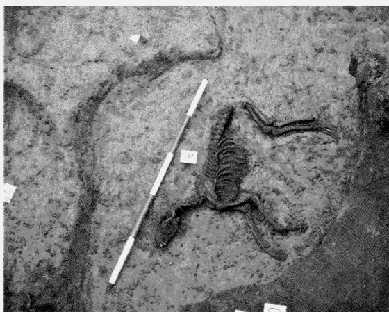
Obr. 7. Malé Hoštice, parc. č. 176/1, 177/1. Pohřeb psa v sídlištním objektu 511 Malé Hoštice, Parz. Nr. 176/1, 177/1. Hundbegräbnis in der Siedlungsgrube 511.

Výkop zpočátku protínal náplavové vrstvy řeky Opavy mocné až 1,8 m. Po dvaceti metrech byl ve výkopu vedeném do jižně orientovaného mírného svahu patrný zlom, kdy spráše začala prudce stoupat až na úroveň 60 cm pod dnešním terénem. Situace byla vyhodnocena jako hrana inundace nedaleké řeky. První zahloubený objekt byl zjištěn zhruba 10 m od této hrany a další byly identifikovány v celé délce ul. Svobody (255 m). Archeologické objekty byly zjištěny také na ul. Luční, která se k ul. Svobody připojovala zleva po 107 m od prvního nálezu, a na ul. Kmochova, která ukončuje ul. Svobody křížením ve tvaru T. Celkem bylo na těchto třech ulicích zjištěno 82 zahloubených objektů a dva kostrové pohřby. Na základě keramického materiálu bylo z tohoto počtu datováno