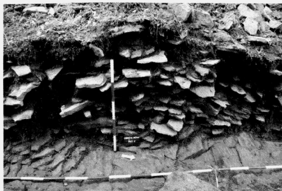
Obř. 9. Otaslavice, okr. Prostějov. „Obrova noha“. Detail kamenné destrukce hradby ve druhém pásmu opevnění. Otaslavice, Bez. Prostějov. „Obrova noha“. Detail der Steindestruktion der Mauer in der zweiten Befestigungzone.