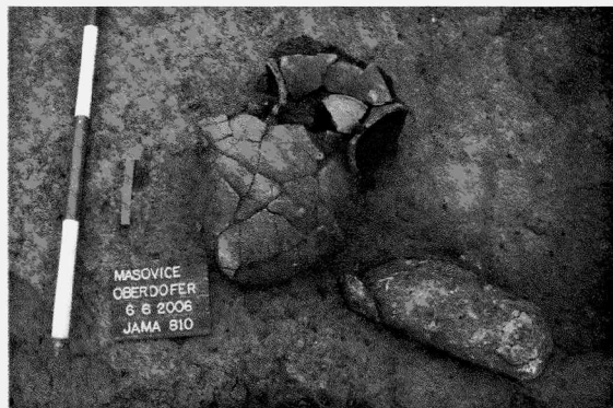
Obr. 12. Mašovice – „Pšeničné“. Detail koncentrace nálezů v soujámí 810

V květnu 2006 byly prozkoumány 2 parcely domů na severozápadním okraji sledovaného území, které se na ZM ČR 33-22-25 v měřítku 1 : 10 000 nacházejí v okolí bodu 360:90 mm od Z:J s.č. Na parcele manželů Pajskrových se podařilo prozkoumat 16 objektů datovaných do mladšího stupně kultury s LnK. Poprvé na lokalitě se podařilo prozkoumat stavební jámu (821) a několik kúlových jam, které společně vytvářejí stavební komplex. Ve stavební jámě se na dně mělké zahloubeniny nacházel skelet pohřbeného novorozence, což je první takový nález na lokalitě. Na druhé parcele rodinného domu Krčková – Hradecký se pak vyskytlo celkem 5 objektů. Stavební jámu 823 můžeme datovat do mladšího stupně LnK, zbytek objektů (2 jamky, zásobnice a soujámí) do průběhu kultury s MMK. V průběhu června byly prozkoumány plo-