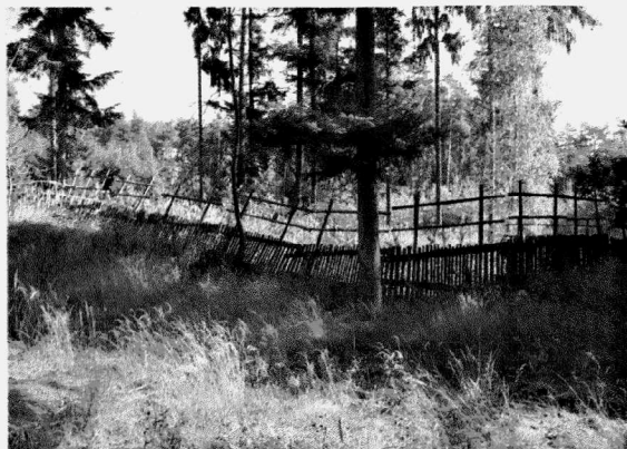
Obr. 10. Cholina. Jedna z mohyl nově objeveného mohylníku KNP.