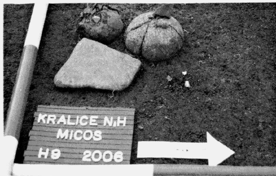
Obr. 9. Kralice na Hané. Průmyslová zóna města Prostějova. ITC MICOS, s.r.o. Žárový hrob LnK č. 9. Kralice na Hané. Industriezone der Stadt Prostějov. ITC MICOS. Brandgrab Nr. 9. Linearbandkeramik.