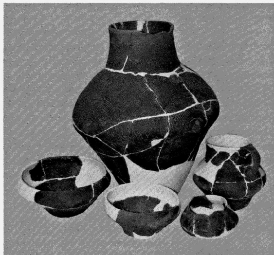
Obr. 14. Mostkovice, okr. Prostějov. Rekonstruované nádoby z objektu K 506.