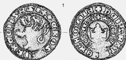
Obr. 141. Radotín. Stříbrná mince – Pražský groš Václava II. Radotín. Silbermünze. Prager Groschen des Wenzel II.