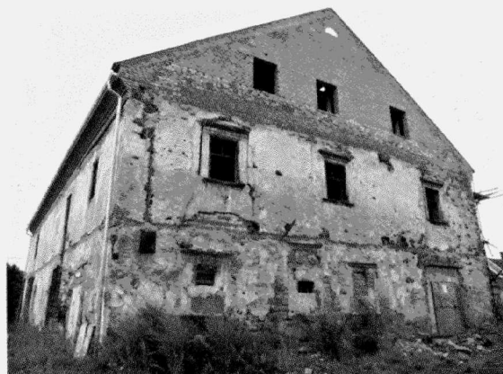
Obr. 124. Podolí u Mohelnice. Pohled na objekt tvrze od severu.