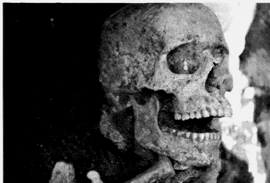
Obr. 161. Znojmo-Václavské náměstí. Detail mladohradištního hrobu 15 s bronzovou náušnicí. Znojmo-Svobody Platz. Detailsicht des jungburgwallzeitlichen Grabes N. 15 mit einem Bronzeohrering.

Na trase stoky AD-6 protnul výkop část kostrového pohřebiště (cca 15 hrobů), které se nachází ve střední a severní části náměstí. Hroby ležely v jednom, v centrální části náměstí pak ve dvou horizontech, přičemž jejich horní vrstva byla porušena realizovanou novodobou valounovou dlažbou, následovala dlažba katovská. V této úrovni se pak vyskytovaly, a to i mezi porušenými kostrovými hroby, středověké a raně novověké střepey. Ve spodním horizontu hrobů se však vyskytovala výhradně keramika mladohradištní, popřípadě pravěká, pocházející z kulturní vrstvy únětické kultury, do níž byly hroby zahlubovány. Zemřelí byli ukládáni v natažené poloze na zádech s orientací V-Z. Z milodarů můžeme zmínit pouze zlomek bronzového kování (?), masivní bronzový kroužek a především bronzovou náušnici z tenkého drátu, kterou doplňují do síťoviny spirálovitě spletené drátky (obr. 161). Na základě zlomků keramiky v zásepu a těchto drobných milodarů pohřebiště časově řadíme do mladohradištního období (obr. 162). Rýha porušila i zdivo presbytáře vrcholně gotického kostela sv. Petra a Pavla, který s hroby již evidentně nesouvisí. Stavba byla asanována v průběhu 2. pol. 19. století. Na ZM ČR 34-11-21 jsou nálezy vymezeny body 360 mm od