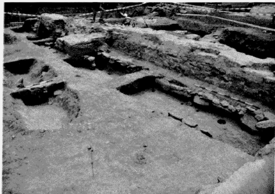
Obr. 154. Znojmo-nám. Svobody. Průběh středověkého opevnění z první poloviny 14. století. Znojmo-Svobody Platz. Verlauf der mittelalterlichen Befestigung aus der 1. Hälfte des 14. Jahrhunderts.