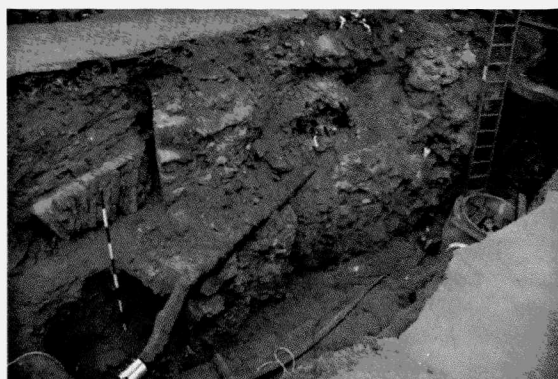
Obr. 163. Znojmo-Komenského náměstí. Pohled na věž a most střední brány městského opevnění. Znojmo-Komenského Platz. Blick auf den Turm und die Brücke über den Graben vor dem Mittel-tor der Stadtbefestigung.

Na trase AD22 se podařilo na východní straně náměstí zdokumentovat stratigrafickou sekvenci vrstev a drobných objektů z průběhu 12.–15. století. Na ZM ČR 34-11-21 se místo nálezu nachází v okolí bodu 403 mm od západní sekční čáry a 50 mm od jižní sekční čáry, nadmořská výška činí 280 m. Směrem do ul. Kovářské byl zachycen průběh městského opevnění v prostoru střední brány, která byla tvořena hlavní a parkánovou hradbou, mohutnou polovalcovou věží