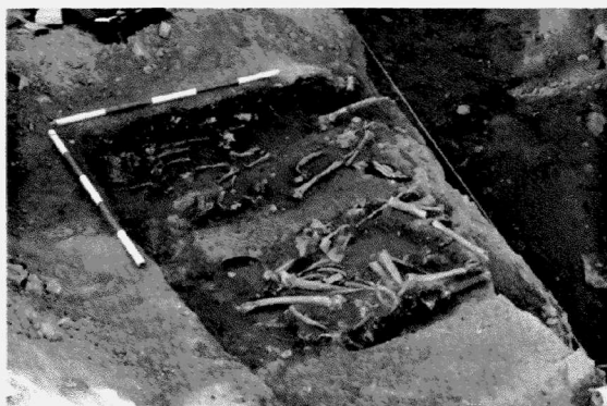
Obr. 162. Znojmo-Václavské náměstí. Celkový pohled na část pohřebiště z 12. století. Znojmo-Václavské Platz. Gesamtansicht eines Teiles des Gräberfeldes aus dem 12. Jahrhundert.

západní sekční čáry, 44 mm od jižní sekční čáry a 357 mm od západní sekční čáry, 47 mm od jižní sekční čáry. Nadmořská výška činí 296 m.