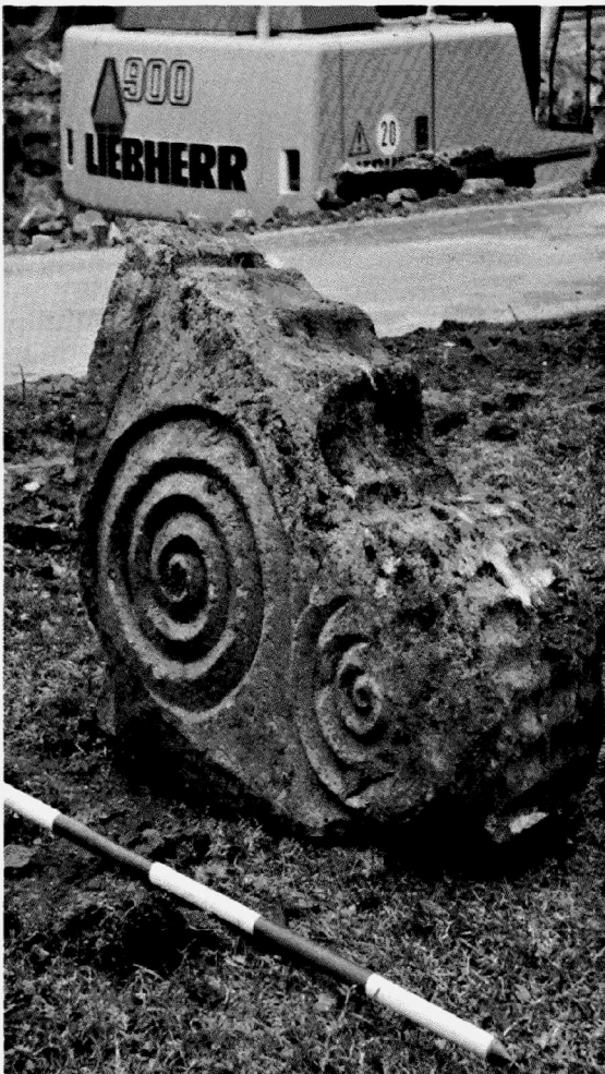
Obr. 159. Znojmo-nám. Svobody. Renesanční článek. Znojmo-Svobody Platz. Renaissancezeitliche Spolie.

Na trase kanalizace AG-1-3 (ISPA Znojmo) na západní straně náměstí byl ovzorkován objekt, který můžeme datovat do mladohradištního období. Narušen byl také větrací kanál do systému středověkého podzemí. Nálezy se nacházejí na ZM ČR 34-11-21 v místě bodu 366 mm od západní sekční čáry a 47 mm od jižní sekční čáry, v nadmořské výšce 294 m. Na trase stoky AG-1 byl zdokumentován v severní části Horního náměstí, směrem do ulice Vlkova, jeden menší středověký objekt. Důležitý je nález horní poloviny mužského kostrového hrobu v rakvi, který můžeme datovat do průběhu 12. století. Jedná se s největší pravděpodobností o samostatný hrob, který byl umístěný podél hlavní komunikace ze znojenského hradu na Prahu. Nálezy se nacházejí na ZM ČR 34-11-21 v místě bodu 367 mm od západní sekční čáry a 51 mm od jižní sekční čáry, v nadmořské výšce 298 m. Na trase stoky AG8/8a na východní straně náměstí byla zachycena kulturní vrstva s keramikou mladohradištní. Za pozornost stojí několik zahloubených objektů ze stejného období, především pak pravděpodobný zbytek polozemnice s kamenným topeništěm (obr. 160). Na ZM ČR 34-11-21 se zmiňovaný prostor nachází v rozmezí bodů 374 mm od západní sekční čáry, 49 mm od jižní sekční čáry a 370 mm od západní sekční čáry, 54 mm od jižní sekční čáry. Nadmořská výška kolísá v rozmezí 293–297 m.