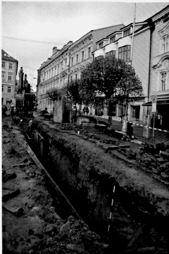
Obr. 160. Znojmo-Horní náměstí. Pohled na mladohradištní kulturní vrstvu. Znojmo-Horní Platz. Blick auf die renaissancezeitliche Kulturschicht.

Václavské náměstí. Doba mladohradištní (12. století), středověk (15. století), novověk. Pohřebiště, kostel sv. Petra a Pavla. Záchraný výzkum.