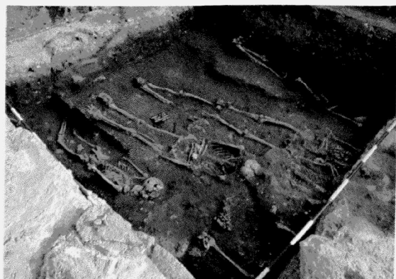
Obr. 156. Znojmo-nám. Svobody. Pohled na část špitálního pohřebiště. Znojmo-Svobody Platz. Blick auf den Westteil des Spitalfriedhofs.