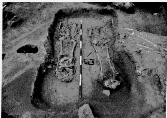
Obr. 158. Znojmo-nám. Svobody. Dvojhrob popravených jedinců. Znojmo-Svobody Platz. Doppelgrab der hingerichteten Individuen.