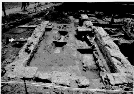
Obr. 155. Znojmo-nám. Svobody. Pohled na půdorys špitálního kostela ze 14. století. Znojmo-Svobody Platz. Grundriß der Fundamentmauern der Spitalkirche aus dem 14. Jahrhundert.