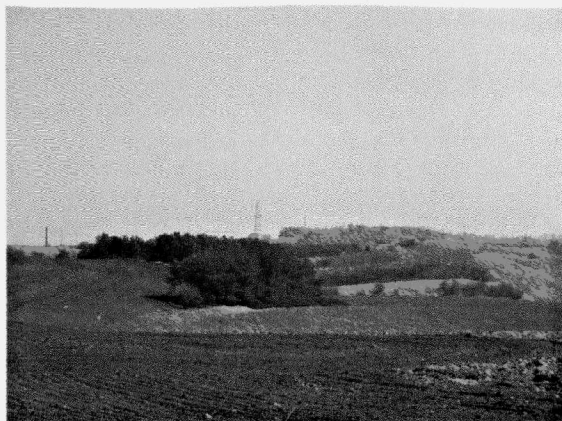
Obr. 10. Smržice, „Vlčí doly“. Žárové pohřebiště KLPP při pohledu od severozápadu. Smržice, „Vlčí doly“. Brandgräberfeld der Lusitzer Urnenfelderkultur von Nordwesten.

Při výstavbě kanalizace v k. ú. Suchohrdly u Miroslavi byla na trase jejího výtaku západně od obce lokalizována dvě dosud neznámá sídliště. Pouze rámcově do pravěku můžeme zařadit lokalitu v trati „Krátké“ s jedním sídlištním objektem a kultúrní vrstvou. Na ZM ČR (list 34-12-11) v měřítku 1 : 10 000 se osídlení reprezentované jámou 503 a kultúrní vrstvou nachází v okolí bodu 76 mm od západní sekční čáry a 161 mm od jižní sekční čáry. Rozkládá se na jižním svahu v nadmořské výšce 210 m na levobřeží potoka Miroslávka. V poloze „U kapličky“ byla porušena velká zásobní jáma, datovaná podle sporadických nálezů keramiky do průběhu starší