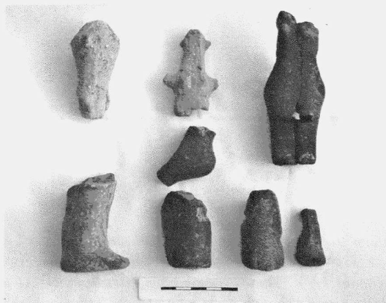
Obr. 23. Znojmo - Novosady. Soubor plastik z objektů MMK Ib (Lengyel I). Znojmo - Novosady. Komplex der Tonplastiken aus den Objekten der MBK Ib (Lengyel I).

Zkoumanou plochu vymezují na ZM ČR 1 : 10 000, kladový list 34-11-21, body: (od Z. s. č.: J. s. č.): 415:88; 418:99; 424:93; 430:90; 426:81 mm. Poloha má mírný východní až severovýchodní sklon. Podloží zde tvoří v horní části terciérní píský s kaolinovými vložkami, které jsou překryty výraznou sprašovou návějí. Na ní ještě místy, především na svahu a v okolí archeologických objektů, nasedá půdní horizont B, který se vytváří v průběhu mladší doby kamenné a v období těsně po zániku neolitického osídlení. Nadmořská výška v prostoru sídliště kolísá v rozmezí 286–292 m n. m.