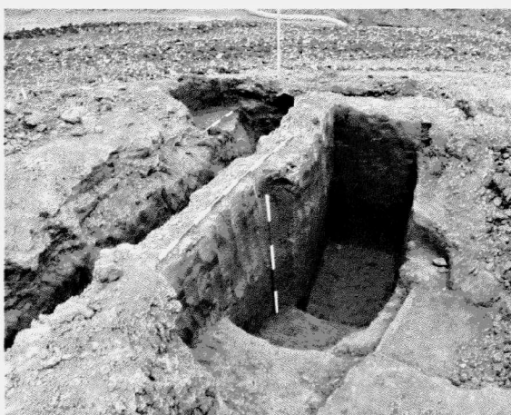
Obr. 21. Zlín-Malenovice. Hliník MMK, narušený středohradištním objektem. Zlín-Malenovice. Lehmgrube der MBK gestörten durch mittelburgwalzeitlichen Objekt.

nou polykulturní lokalitu v oblasti dolního Podřevnicka. Z předchozích výzkumů v tomto prostoru zde byla doložena existence LnK, MMK, dále KLPP a stopy osídlení z doby před polovinou 13. století. V průběhu záchranného výzkumu se podařilo zachytit část poměrně rozsáhlého hliníku o rozměrech 7,3 × 5,2 m, max. hloubka – 2,1 m (obr. 20). Z výplně objektu bylo získáno značné množství archeologického materiálu – zrnotěrky, štípaná industrie, keramika (téměř 1000 předmětů), které lze zařadit do období kultury MMK. Jedná se zatím o největší a nejbohatší objekt svého druhu v regionu Podřevnicka. Mezi zajímavé nálezy patří např. miniaturní závěsná nádoba. Ve spodních partiích výplně objektu se objevila nečistá příměs fragmentů starší neolitické kultury s lineární keramikou. Nejzajímavějším předmětem z tohoto souboru LnK je torzo hliněné plastiky, která je prvním nálezem svého druhu na Podřevnicku.