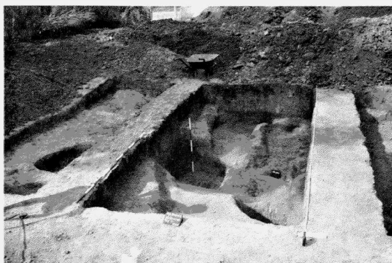
Obr. 20. Zlín-Malenovice. Západní část hliníku kultury s MMK. Zlín-Malenovice. Westteil der Lehmgrube der MBK.

Jak se ukázalo při výzkumu v roce 2005, tuto lokalitu (nemá žádné místní lidové označení) v minulosti proflala právě silnice I/49 (hlavní spojnice mezi Zlínem a Otrokovicemi) a souběžně i železniční trať mezi oběma uvedenými městy. Předpokládaný rozsah lokality tak tvoří nepravidelný ovál o průměru ca 900 m. Jedná se vlastně o mírnou terénní vyvýšeninu nad tokem (levobřeží) potoka Baláše, která je nad okolním terénem převýšena ca o 2 m. Naleziště je situováno na ZM 1 : 10 000, č.l. 25-31-24, od Z s.č. 459 a 463 mm, od J s.č. 153 a 154 mm. Nadmořská výška v prostoru lokality se pohybuje mezi 203,74 a 202,36 m. V těchto místech byly již v minulosti zjištěny stopy staršího osídlení, jedná se vedle známých lokalit Mezicestí a Chmelína vlastně o třetí význam-