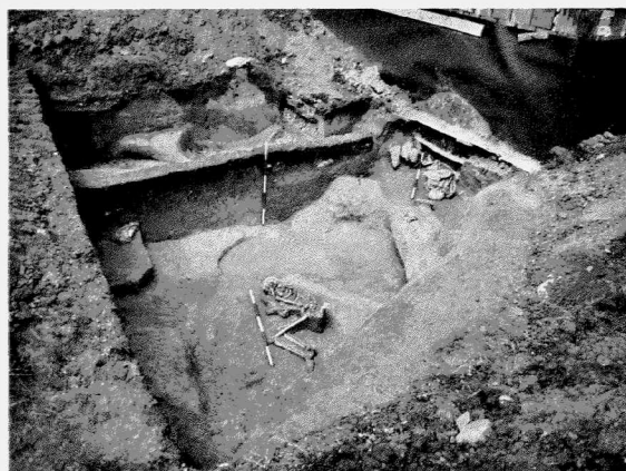
Obr. 10. Znojmo. Celkový pohled na prozkoumanou část hliníku únětické kultury. Znojmo. Amblick auf den untersuchten Teil den Lehmgrube der aunjetitzer Kultur.

Smetanova Str. Die mitteldonauländischen Urnenfelderkultur. Siedlung. Rettungsgrabung.