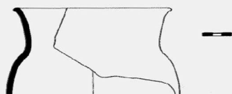
Obr. 9. Záhlinice. Keramika ze žárového hrobu. Záhlinice. Keramik aus dem Brandgrab.

Nádoba 2: část hrnce s válcovitým hrdlem; materiál středně hrubý, prům. ústí 160 mm.