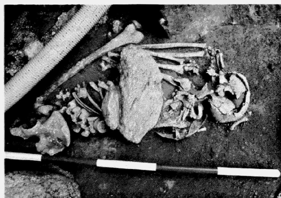
Obr. 11. Znojmo. Detail pohřbeného muže v kamenné skřínce. Znojmo. Detail eines in der Steinpackung beige-setzten Mannes.