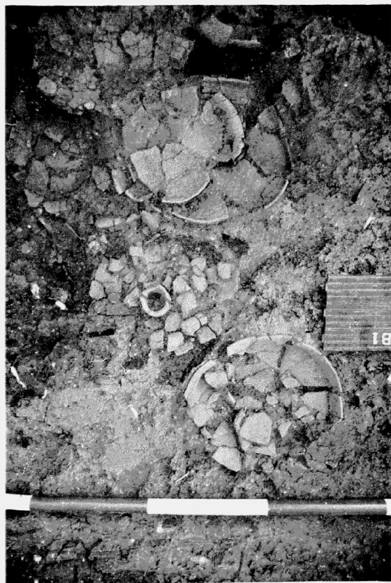
Obr. 6. Tulešice II. Detail keramických milodarů v hrobě (?) horákovské kultury.

Na trase výtaku kanalizace v bezejmenné trati východně od obce bylo prozkoumáno celkem 9 objektů a řada kultur-