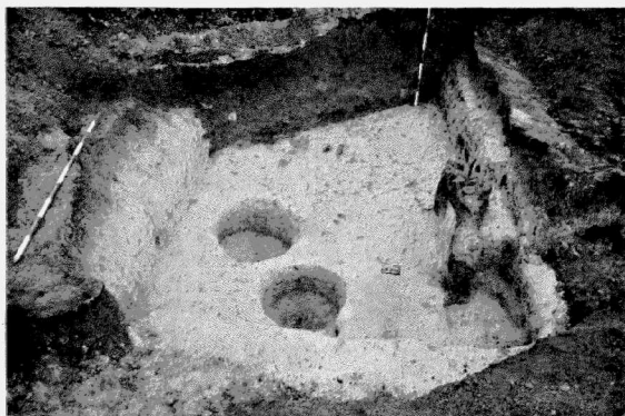
Obr. 8. Višňové (okr. Znojmo). Celkový pohled na pozemnici 502.

Tulešice II. Keramische Beigaben in einem Grab (?) der Horákov Kultur.