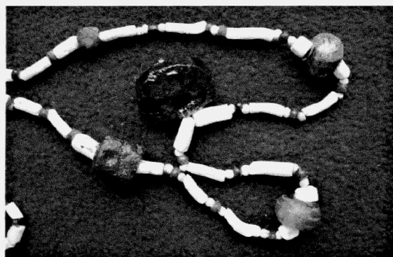
Obr. 6. Nový Šaldorf. Část náhrdelníku z pol. 5. století. Nový Šaldorf. Teil einer Perlenkette, um die Mitte des 5. Jhs.