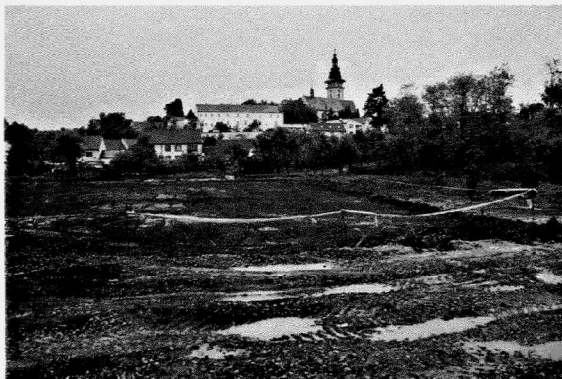
Obr. 146. Moravské Budějovice. Celkový pohled na historické jádro města od západu, v popředí sledovaná plocha. Moravské Budějovice. Gesamtansicht auf den historischen Stadtkern vom Westen, im Vordergrund die erforschte Fläche

nachází v průsečíku souřadnic od 65 mm od západní sekční čáry a 293 mm od jižní sekční čáry. Ze severu vymezuje plochu tok říčky Rokytka a zkoumané území se nachází v jejím inundačním pásmu. Nadmořská výška činí 444 m. Podloží, které bylo zjištěno pouze v místech výkopů inženýrských sítí, tvoří tmavě okrová jílovitá degradovaná spraš.