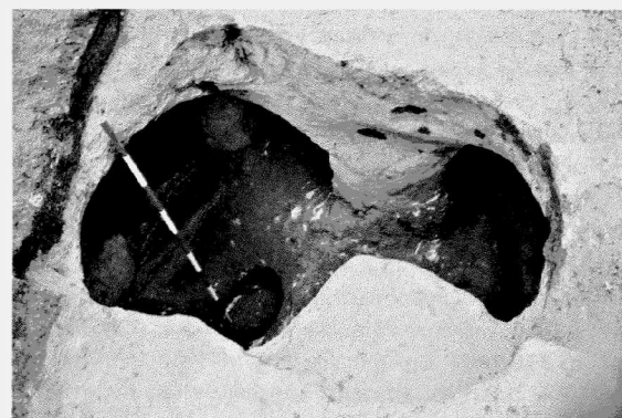
Obr. 140. Miroslav – intravilán města. Prozkoumaná vstupní část lochu z 15. stol. Miroslav – Innenbereich der Gemeinde. Der erforschte Eingangsteil des unterirdischen Erkelers aus dem 15. Jh.