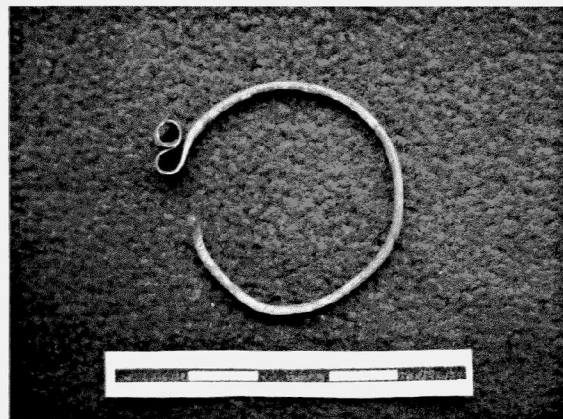
Obr. 139. Miroslav – intravilán města. Esovitá záušnice z objektu 530 (12. stol.). Miroslav – Innenbereich der Gemeinde. Schlafenering aus der Grube 530 (12. Jh.).