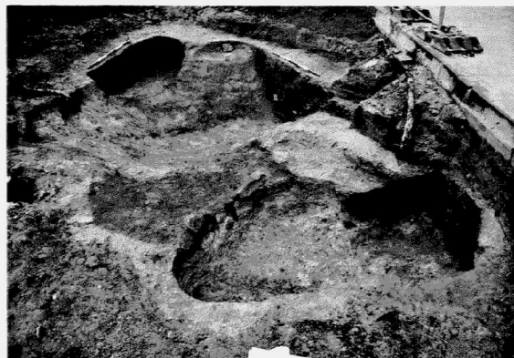
Obr. 138. Miroslav – intravilán města. Příklad výrobního objektu 530 s baterií pecí z 12. stol. Miroslav – Innenbereich der Gemeinde. Die Grube 530 mit einer Ofengruppe aus dem 12. Jh.

Po středohradištním období (9. stol.) zaznamenáváme velkou intenzitu osídlení v průběhu 12. stol. Reprezentují ho především objekty výrobního typu z bateriemi pecí (obr. 138), polozemnice a další objekty. Z drobných nálezů stojí za pozor-