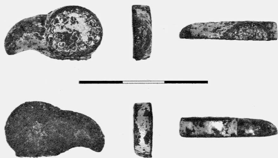
Obr. 3. Drnholec. Hlavička dravého ptáka. Drnholec. Head of a predatory bird.