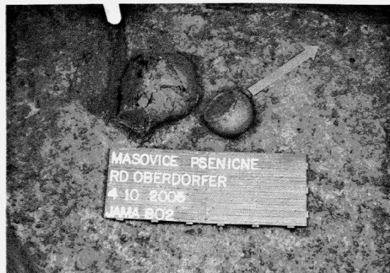
Obr. 12. Mašovice. Votivní keramického depozitum (?) v ústí zásobnice kultury nálevkovitých pohárů. Mašovice. Votivkeramikdepozitum in der Mündung der Vorratsgrube der Trichterbecher Kultur.