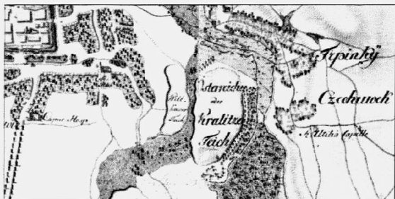
Obr. 131 Výsek I. vojenského mapování z let 1764–1768 a 1780–1783 s okolím Kralic, listy č. 51 a 52. Ausschnitt aus dem Ersten oder Josephinischen Landesaufnahme (1764–1768 und 1780–1783), Blätter N. 51, 52. Österreichisches Staatsarchiv, Kriegesarchiv, Section N.51, 52.