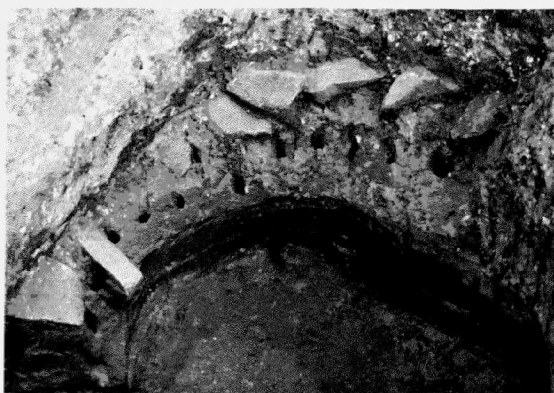
Obr. 132. Kralice na Hané, Průmyslová zóna města Prostějova. Detail konstrukčních prvků jímky datované do 2. poloviny 14. století (obj. 1649). Kralice na Hané, Industriezone der Stadt Prostějov. Konstruktionselemente der Versteifung der Kloake, 2. Hälfte des 14. Jh. (Bef. 1649).

s rybníky, které v tomto prostoru zakládal již vysoký úředník zemských desek v Olomouci Heralt z Kunštátu, manžel Johanky z Kravař. Ten někdy po roce 1487 zřídil uprostřed rozlehlé louky Rohoznice mezi Prostějovem a Bedihoští dva chovné rybníky, jejichž počet se do roku 1544 rozrostl nejméně na šest. Poněkud paradoxně právě rozvinuté vodní hospodářství s výnosným chovem ryb zde vedlo až k zániku osady Staré Vsi (jedna z mála přímo archeologicky doložených zaniklých osad na Prostějovsku – viz níže zpráva o výzkumu vyvolaném na k. ú. Kralice na Hané výstavbou logistického areálu firmy Spedition Feico, s.r.o.) a také nedalekých Rakousků, které se na stále se zmenšujících pluzních již nedokázaly uživit a staly se pro vrchnost obtížnými a zřejmě i ztrátovými. Obyvatelé byli, jak zaznamenává purkrechtní kniha, převedeni do města Prostějova a obě vesnice jsou koncem 15. a na počátku 16. stol. uváděny již jako zcela pusté. Hráze rybníků, jež jsou v písemných pramenech zmíněny ještě k roku 1584, najdeme však v terénu dodnes (cf. Šrot 1979; týž 1986).