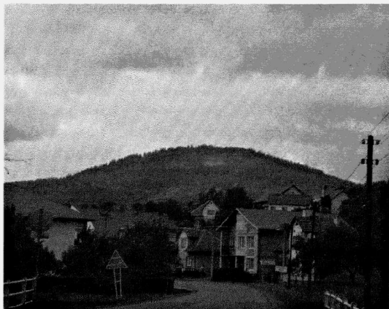
Obr. 181. Vysoké Pole, „Klášfov“ – pohled na lokalitu od jihu. Vysoké Pole, „Klášfov“ – Südansicht.